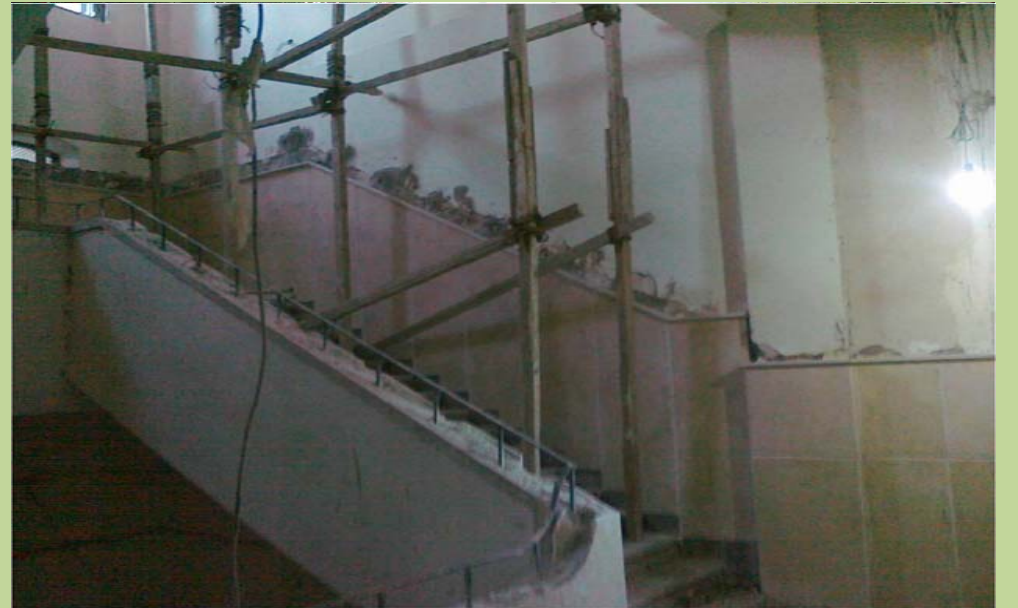
أعمال إحلال وتجديد حوائط وسلالم مبنى الإدارة