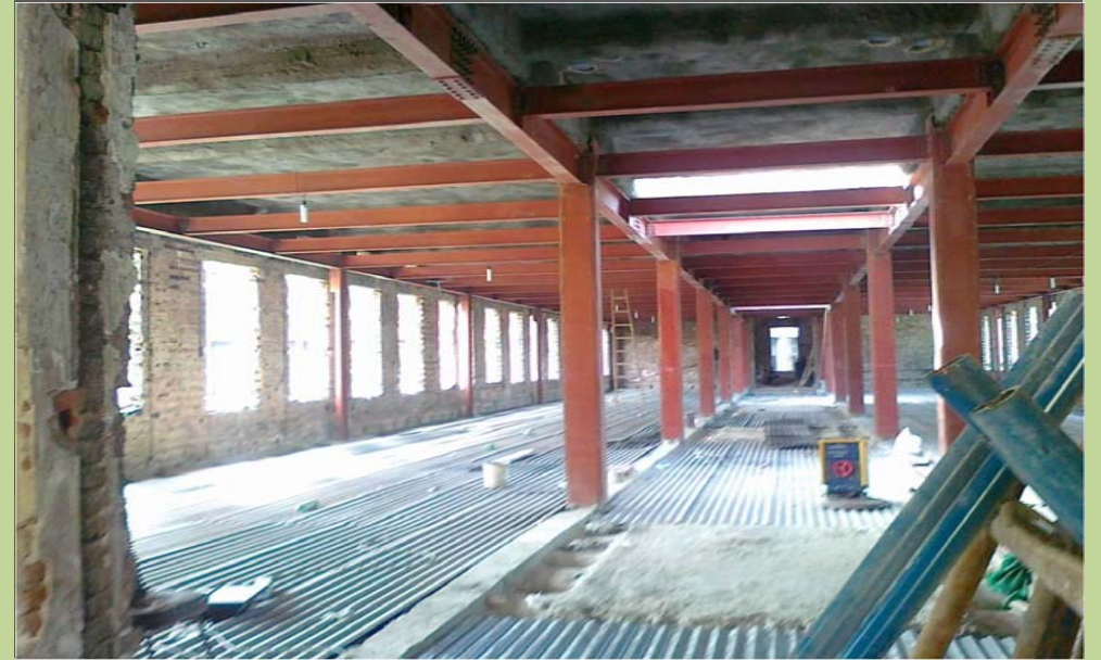
أعمال تدعيم أرضية الدور الثاني