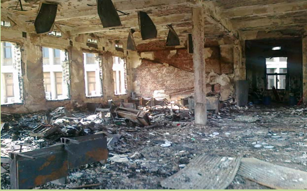
اثر الحريق بالدور الثاني - مبنى الادارة