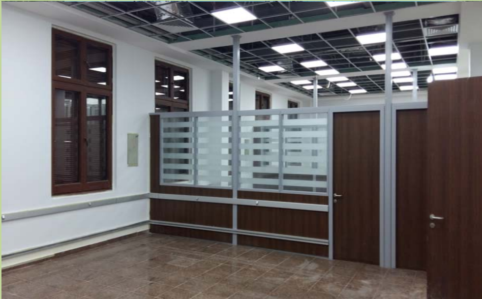
أعمال تركيب الفواصل بين الفراغات المخصصة للمراكز