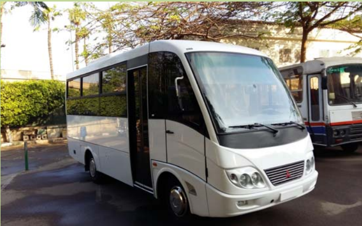
أتوبيس جديد للكلية (تمويل ذاتي) سعة ٣٠ راكب