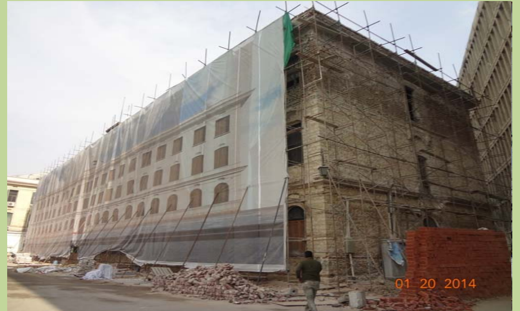
تفتيش الجهات تمهيدا لأعمال المعالجة