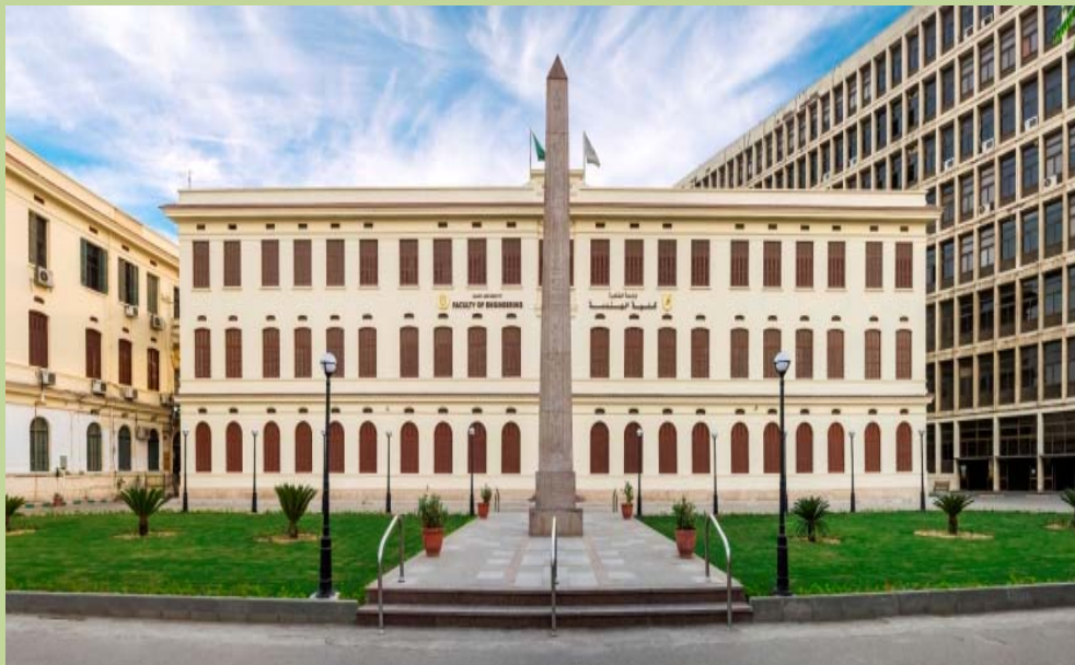
مبنى الإدارة والحديقة بعد الإنتهاء من أعمال الإحلال والتجديد