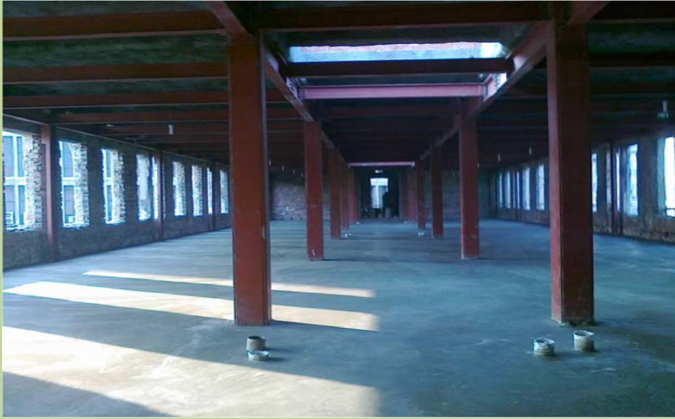
أعمال المنشأ المعدني - تدعيم أرضية الدور الثاني