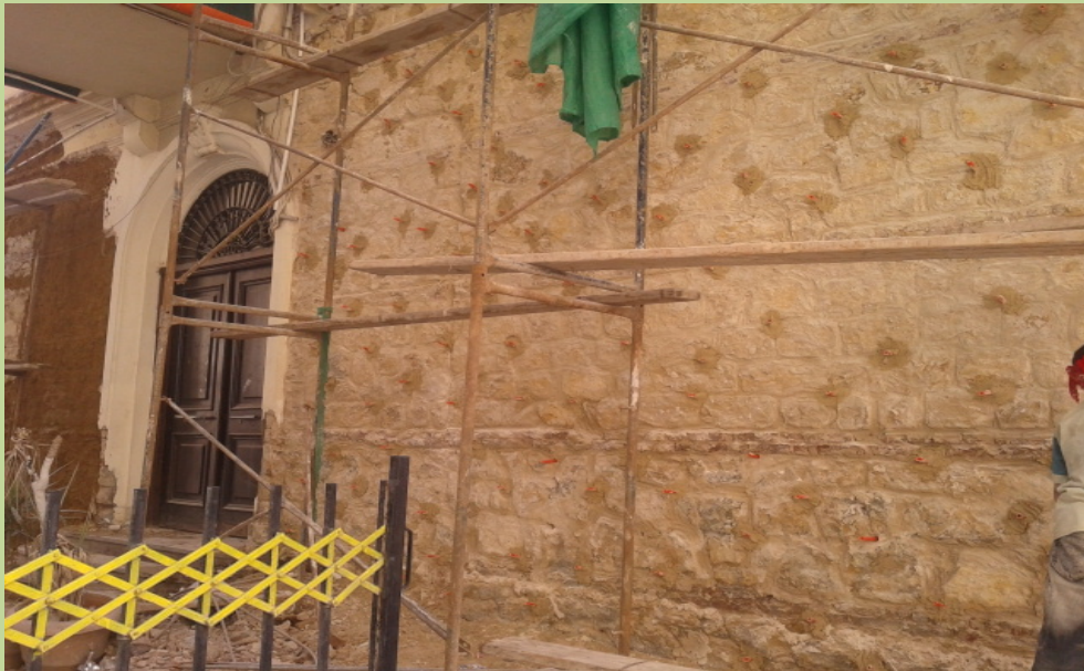
أعمال حقن الحوائط