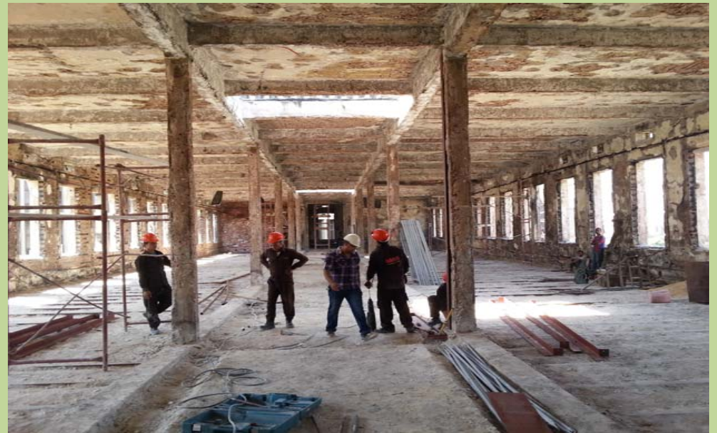
أعمال تدعيم سقف الدور الثاني - المنشأ المعدني