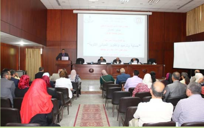
ورشة عمل " حماية وترميم وتطوير المباني الأثرية "