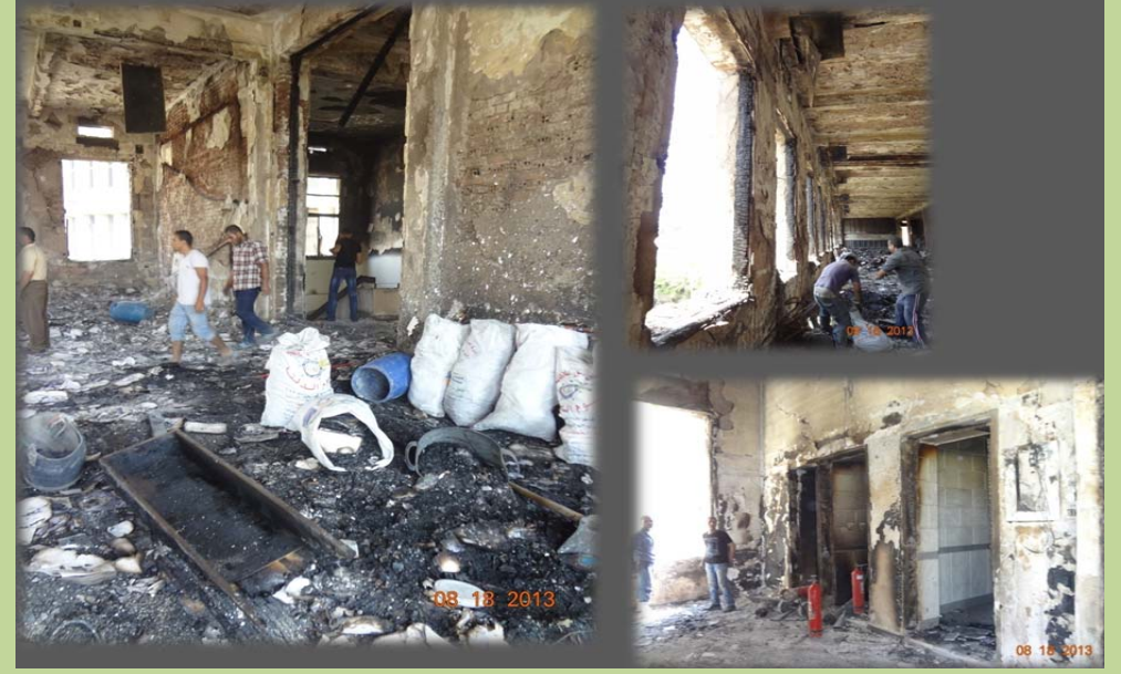
اثر الحريق بالدور الثاني - مبنى الادارة