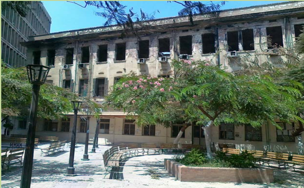
اثر الحريق - الواجهة الخلفية لمبنى الادارة