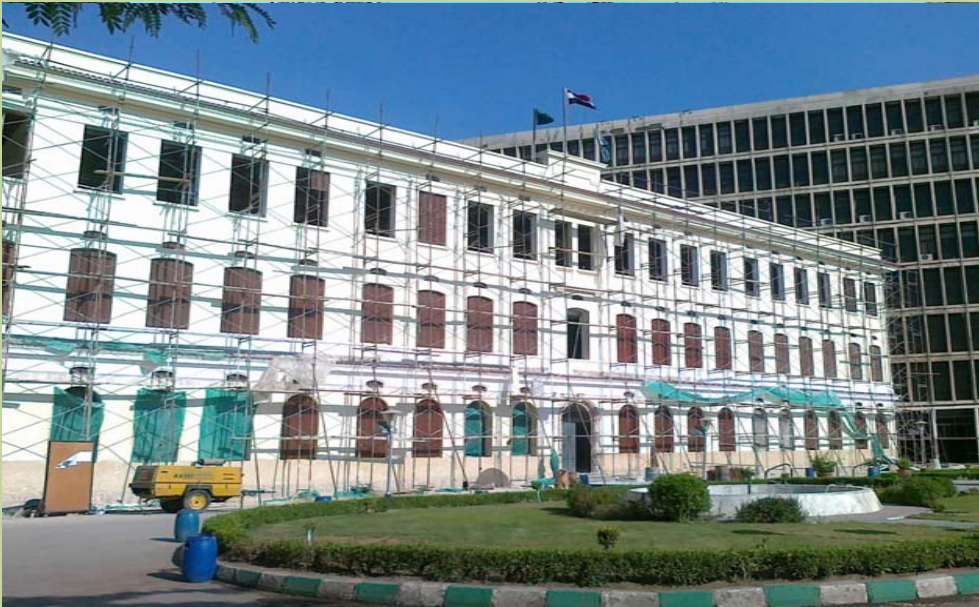
أعمال تركيب الشبائيك والأشيش الخارجية