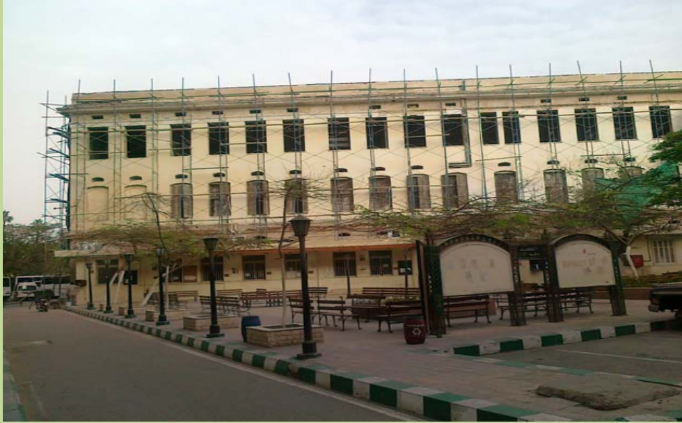
أعمال الإحلال والتجديد بالواجهة الخلفية للمبنى