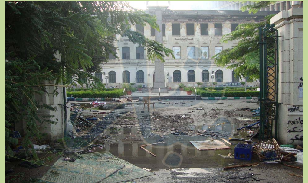
البوابة الرئيسية للكلية - ٢٠١٣/٨/١٥