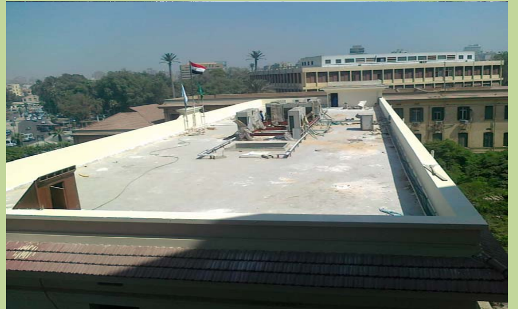
وحدات المكثف الخارجية الخاصة بوحدات التكييف المركزي