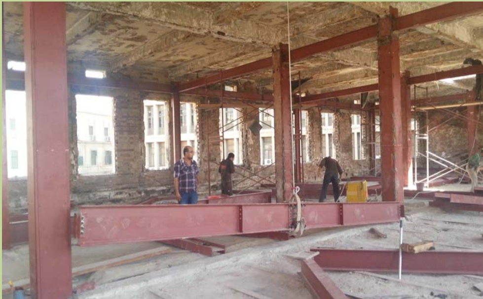
أعمال تدعيم سقف الدور الثاني - المنشأ المعدني