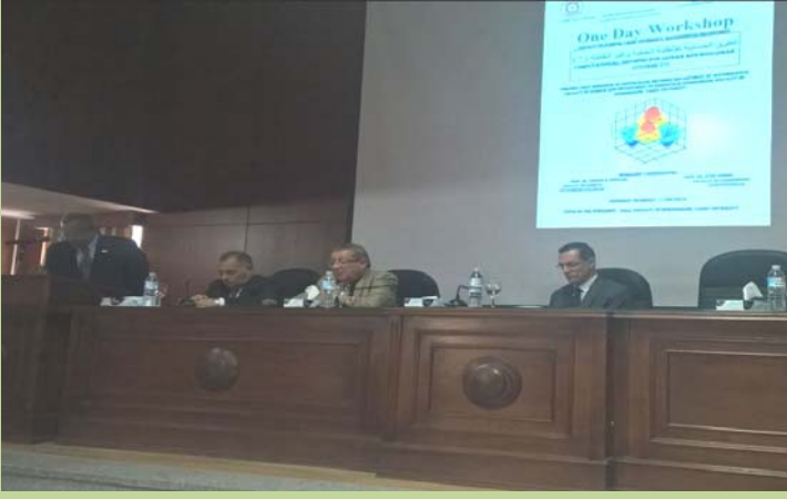
ندوة " الطرق الحسابية لأنظمة الخطية وغير الخطية (7) "