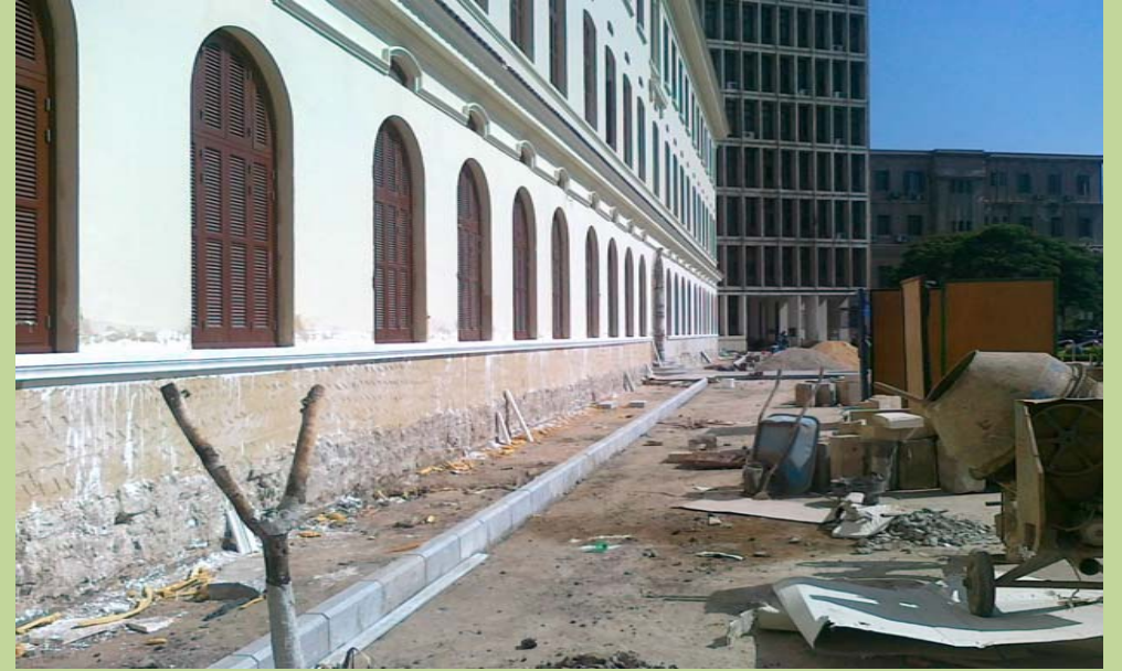
أعمال تطوير وتأهيل الأرصفة أمام المبنى