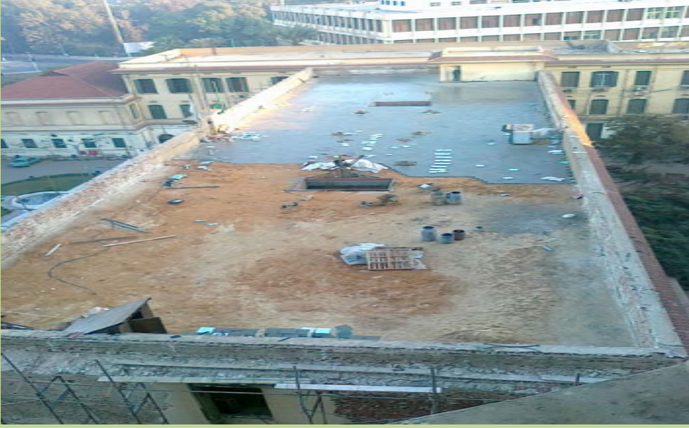
أعمال تطوير سطح مبنى الإدارة