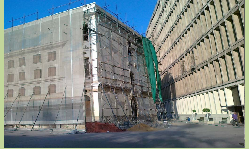
أعمال تركيب الكرانيش بواجهات المبنى