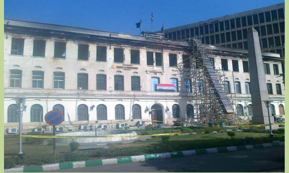
أعمال انزال مخلفات الحريق من الدور الثاني