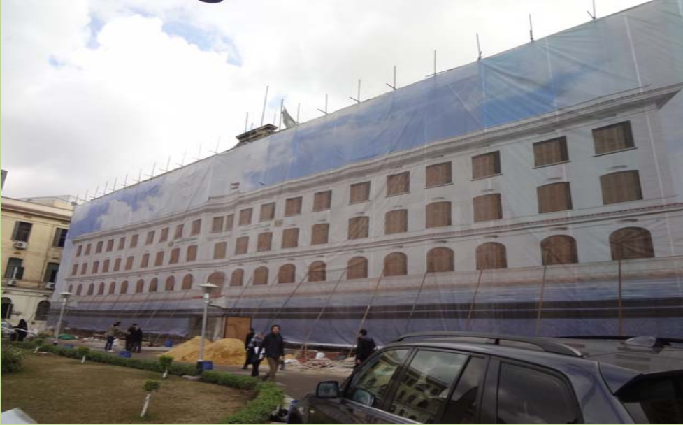
تغطية الواجهة الامامية لمبنى الادارة