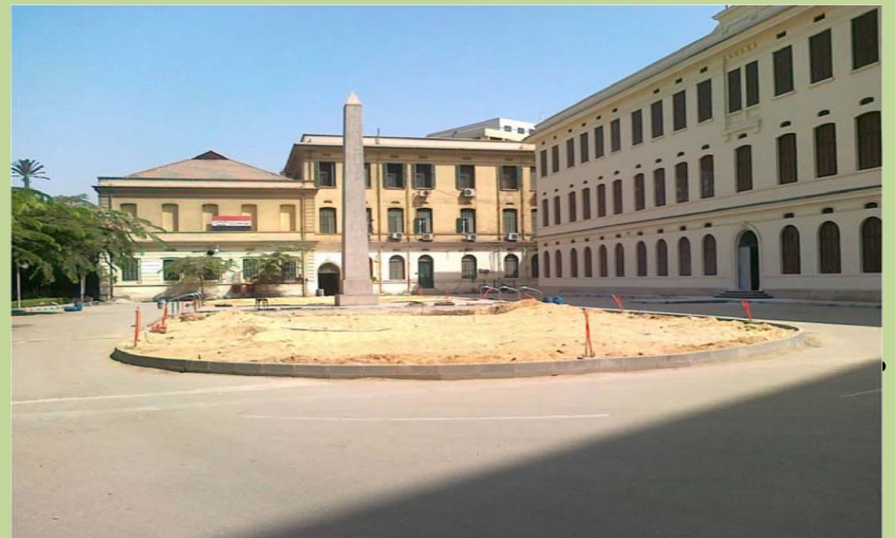
أعمال تطوير الحديقة أمام مبنى الادارة