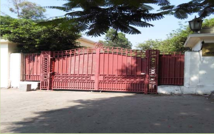
المدخل الرئيسي لملحق الكلية بعد تركيب البوابة الجديدة