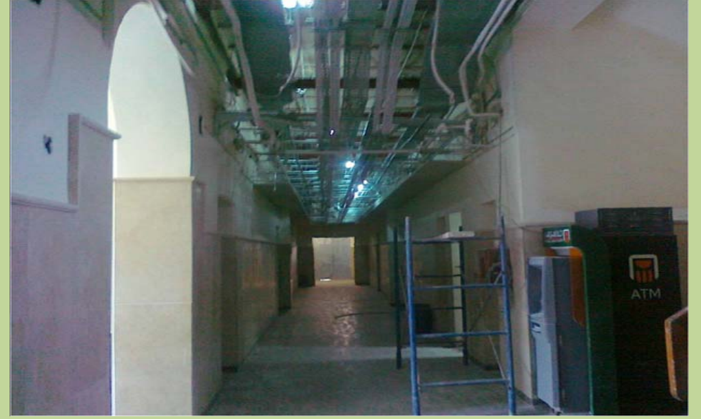
أعمال تركيب الشبكات ومسارات التبريد المركزي فوق الاسقف المعلقة