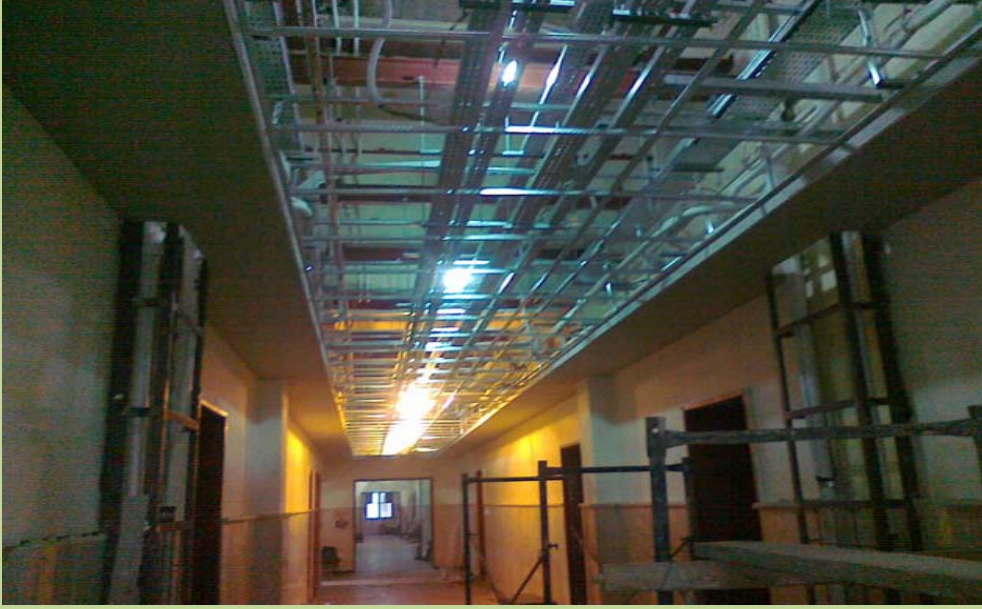
أعمال تركيب الشبكات ومسارات التبريد المركزي فوق الاسقف المعلقة