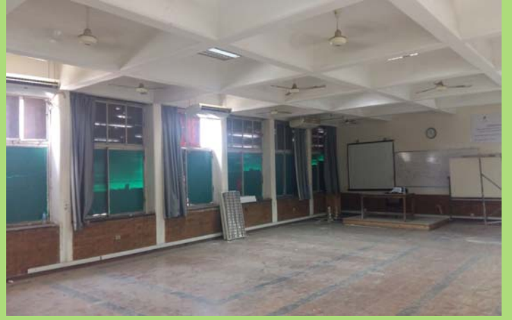
قاعة ٢٠٥٠٨ قبل البدء فى أعمال الإحلال والتجديد