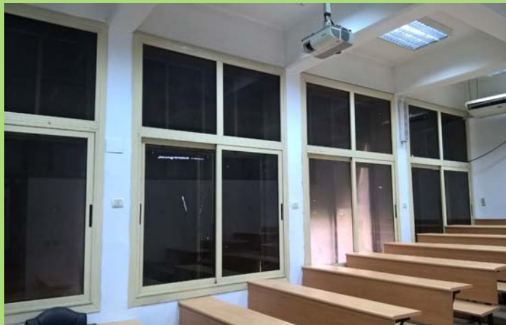
قاعة تدريس بالدور الارضى بمبنى إعدادي بعد الانتهاء من أعمال الدهانات