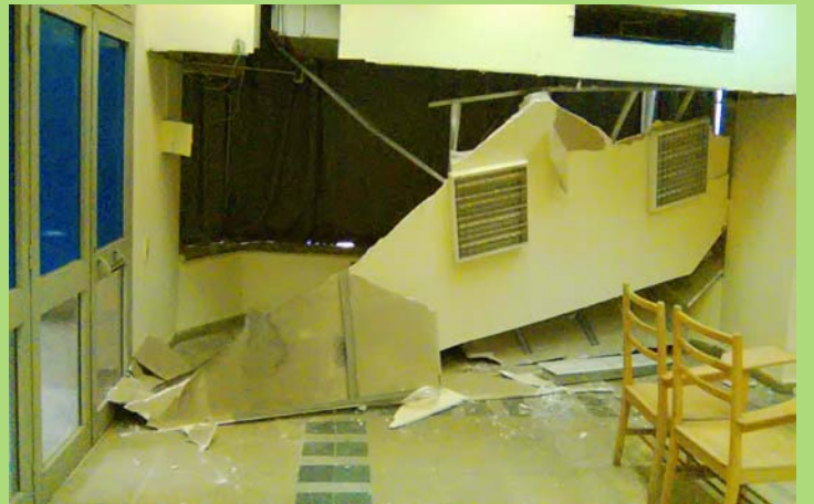
تساقط جزء من السقف المعلق بقاعة ١٨٢٠٢ بمبنى الأنشطة