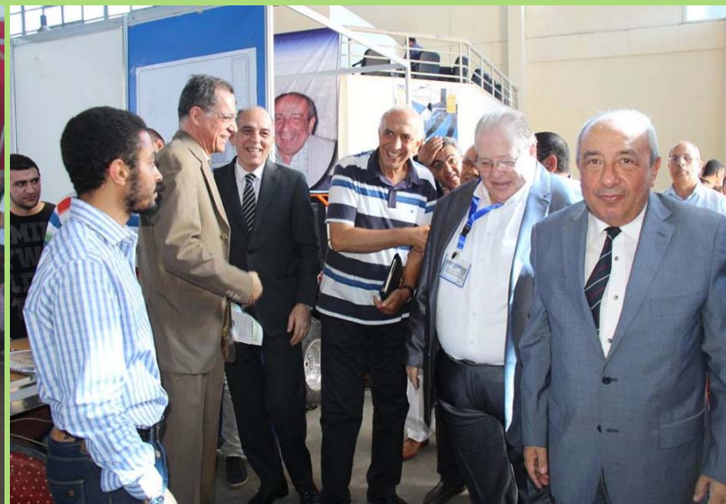
فريق الكلية المشارك في الملتقى الأول للابتكارات لخريجي كلية الهندسة