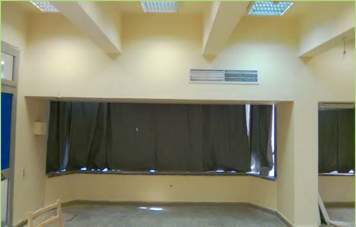
السقف المعلق بقاعة ١٨٢٠٢ بمبنى الأنشطة بعد الإحلال والتجديد