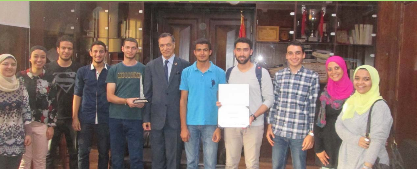
فريق الكلية المشارك في مسابقة دبي هايبرلوب (Dubai Hyperloop)