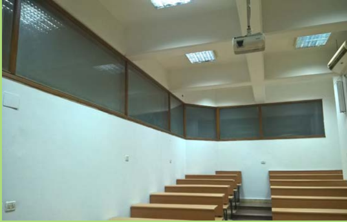
قاعة تدريس بالدور الارضى بمبنى إعدادي بعد الانتهاء من أعمال الدهانات