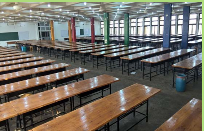
تراييزات الرسم بقسم عمارة بعد الإنتهاء من أعمال التجديد