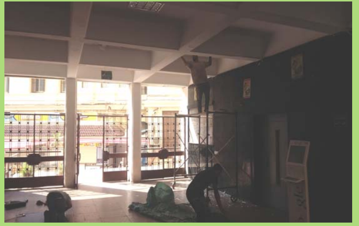
أعمال الدهانات بسقف بهو المدخل الرئيسي لمبنى إعدادي