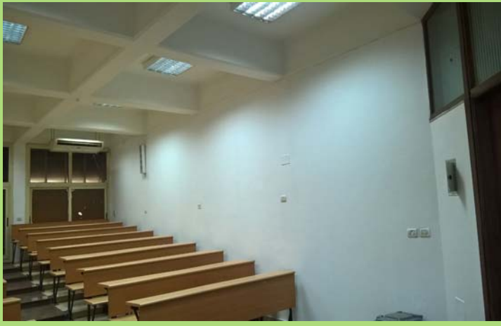
قاعة تدريس بالدور الارضى بمبنى إعدادي بعد الانتهاء من أعمال الدهانات