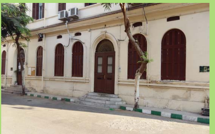
شبابيك الدور الأرضى بمبنى المطبعة بعد أعمال الإحلال والتجديد