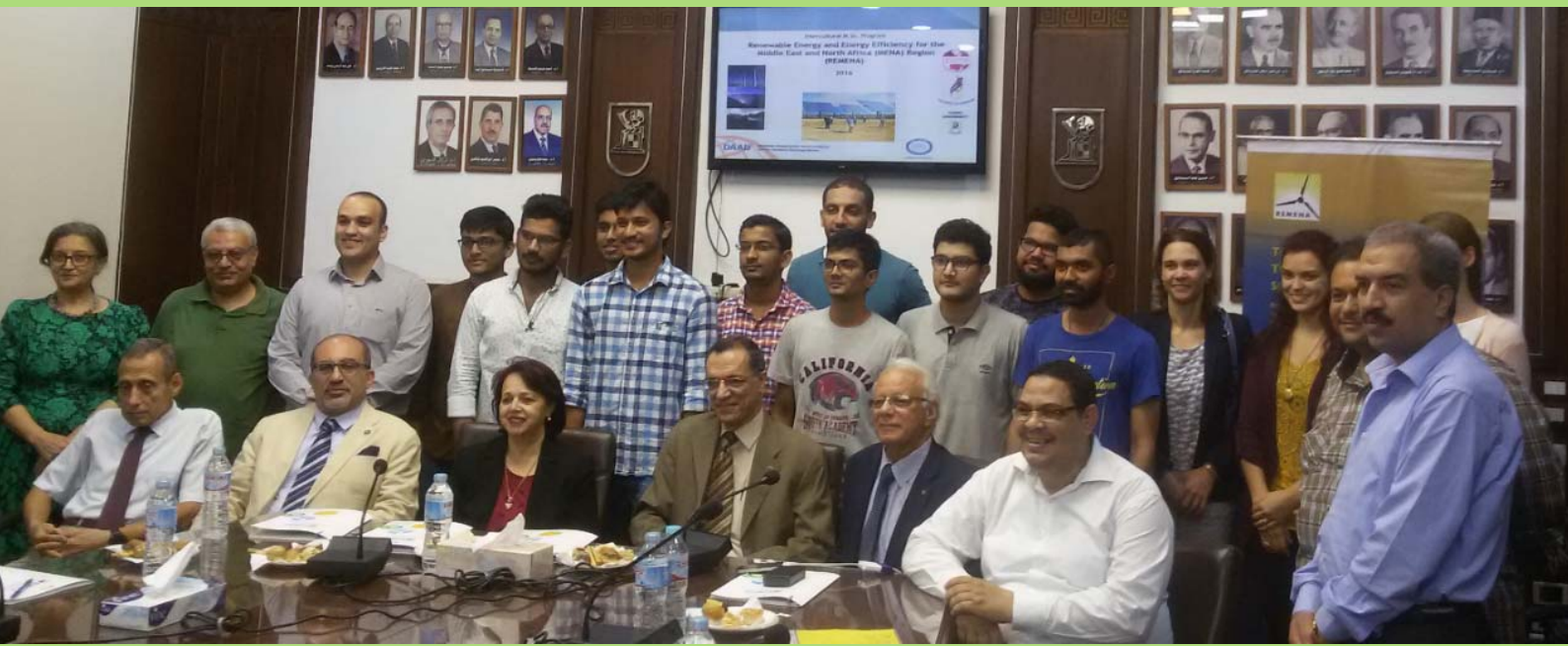
أعضاء هيئة تدريس وطلاب ماجستير الطاقة الجديدة والمتجددة