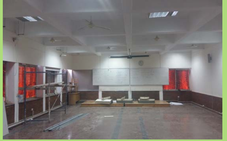
قاعة ٢٠٥٠١ قبل البدء فى أعمال الإحلال والتجديد