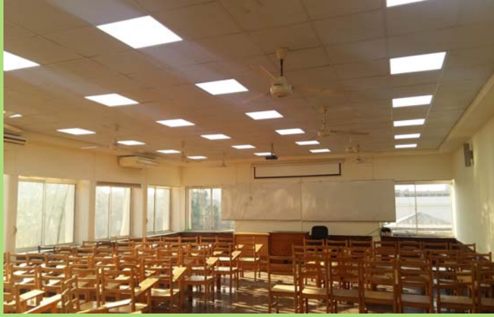
قاعة ٢٠٥٠١ بعد الإنتهاء من أعمال الإحلال والتجديد