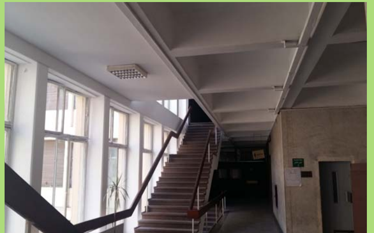
درابزين وأسقف وأعمدة السلم الرئيسي بعد الانتهاء من أعمال الدهانات