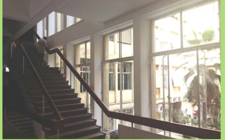
أعمال الترميم والدهانات - درابزين السلم الرئيسي بمبنى إعدادي