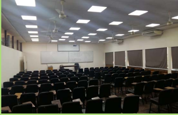
قاعة ٢٠٥٠٨ بعد الإنتهاء من أعمال الإحلال والتجديد